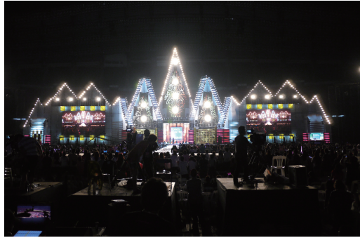
[공연 직전 무대]