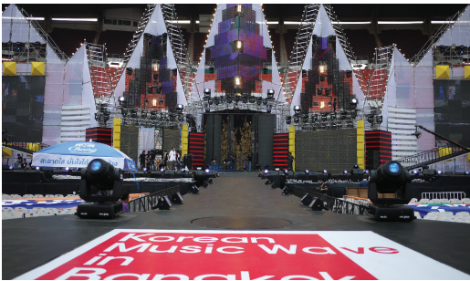
[무대 설치가 끝난 모습]

무대와 Follow spot간의 거리도 멀었고, 태국 Follow spot도 15년 이상의 노후화된 장비여서 무대에서 조도확보에 어려움이 있었다. 방송에 필요한 조도를 확보하기 위해서 공연 시 13대의 Follow spot을 모두 무대 센터에 모아야 했다. 돌출 무대에 여러 가수가 흩어져서 노래를 할 때 전체무대의 조도 확보에는 어려움이 있었다. 공연 전날인 3월 11일에 무대 설치가 모두 끝이 나고, 출연 가수들의 스케줄이 빠듯한 것과 많은 곡을 소화해야 했기에, 드라이 리허설은 11일 저녁부터 공연날인 12일 아침까지 밤새 계속 되었다.