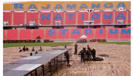
[현지 도착 직후 무대 모습]