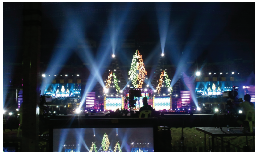
[메모리 작업 중]