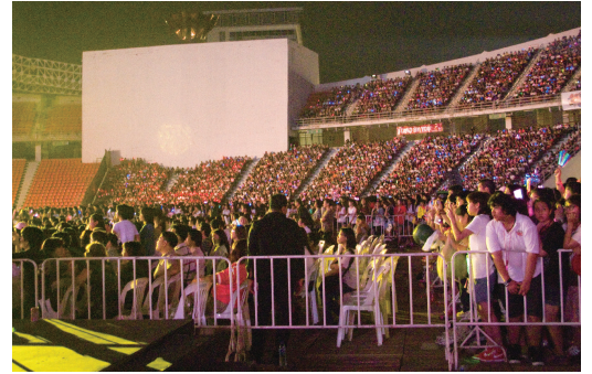
[관람 중인 태극 관객]