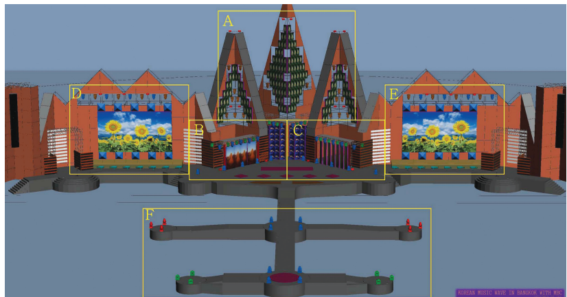
[각 Port별 Patch 도면]

시뮬레이션 작업을 통해 Fixture의 위치와 포커싱 작업을 지시하였다. 태국 도착 일정이 빠듯하여 국내 스텝들이 도착하기 전에 Layer에 위치하는 Fixture들은 대부분 설치되어야 했다. 태국 현지의 조명 설치와 렌탈 업체는 우리가 사용하는 시뮬레이션 프로그램이 없어서 디자인이 다 끝난 다음에 다시 그림파일로 변환하는 작업을 거쳐야 했다. 각 Port별 Patch 도면이 약 20장, 3D 시뮬레이션 사진이 약 15장. 국내에서 작업 시 간단히 끝낼 수 있는 작업이 현지와의 커뮤니케이션 문제 때문에 많은 시간을 필요로 했다.