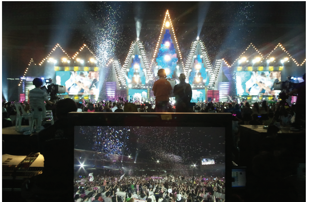
[공연 중인 무대]

KOREAN MUSIC WAVE(한류콘서트)라는 이름으로 처음 진행된 콘서트였다. 현재 한류의 중심에 있는 가수들이 총출동하였고, 해외에서 대규모의 콘서트를 녹화한 의미 있는 작업이었다. MBC 조명팀도 조명 디자인부터 무대세팅과 공연까지 책임지고 성공리에 끝마친 공연이었다. 방송을 위한 콘서트였기 때문에 아직 점수를 줄 수는(방송 전에 원고작성) 없었지만, 공연당시의 현장 분위기나 쇼를 하면서 모니터했던 그림, 그리고 MBC 조명팀의 해외공연 총괄이라는 관점에서 이미 성공적인 공연이라고 평가한다.