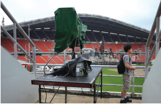
[Follow spot 위치에서 본 무대]