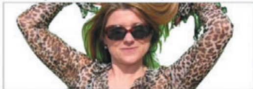
A Leading Competitor's Chroma Keyer